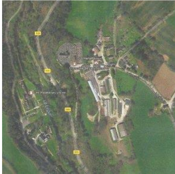
Les papeteries Vallée à Locmaria sur la rivière du Léguer, le cimetière et le monument de Lady Mond.