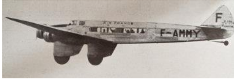
Né à Rennes le 31 octobre 1889 - Mort à Corbigny (Nièvre) le 15 janvier 1934.

Aviateur, pionnier de l'aviation commerciale internationale, pilote à la Franco Roumaine où en 1922 il réalisa la première liaison commerciale Bucarest-Constantinople-Ankara, puis chef pilote de cette compagnie en 1923, il ouvrit le service postal France-Indochine en 1930. Il créa Air-Orient en 1926. Il se tue le 15 janvier 1934 lors du crash de son avion Dewoitine D.332 "L'Émeraude" à Corbigny (Nièvre), de retour d'Indochine. Ses 10 passagers dont le gouverneur général français de l'Indochine Pierre Pasquier sont tués. A l'aller il venait d'établir le record de vitesse entre Paris et Saïgon.