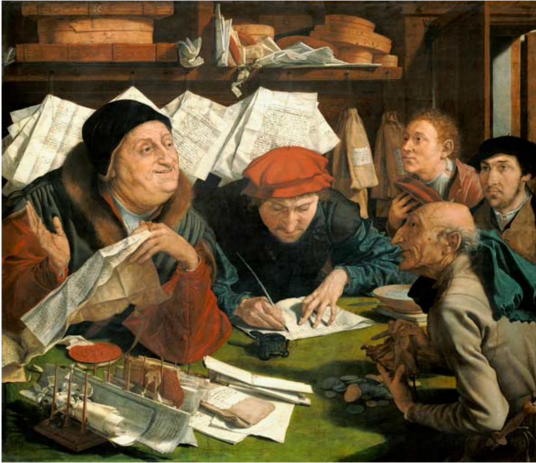
Un perceuteur des impôts Marinus Claesz van Reymerswaele (ca 1490-ca 1546) Wikimedia commons